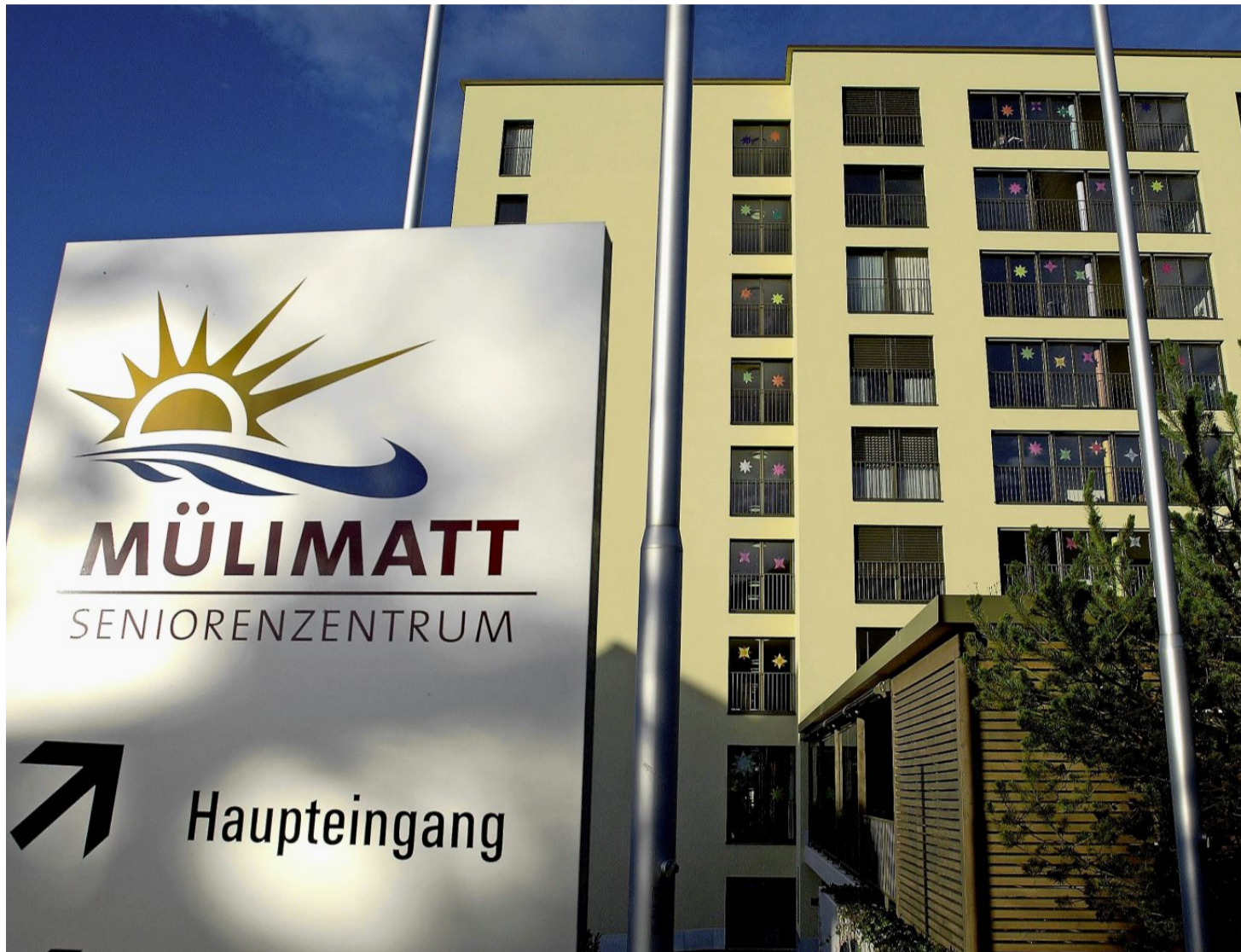
Das Seniorenzentrum Mülimatt in Oberwil kurz nach seiner Neueröffnung 2006.