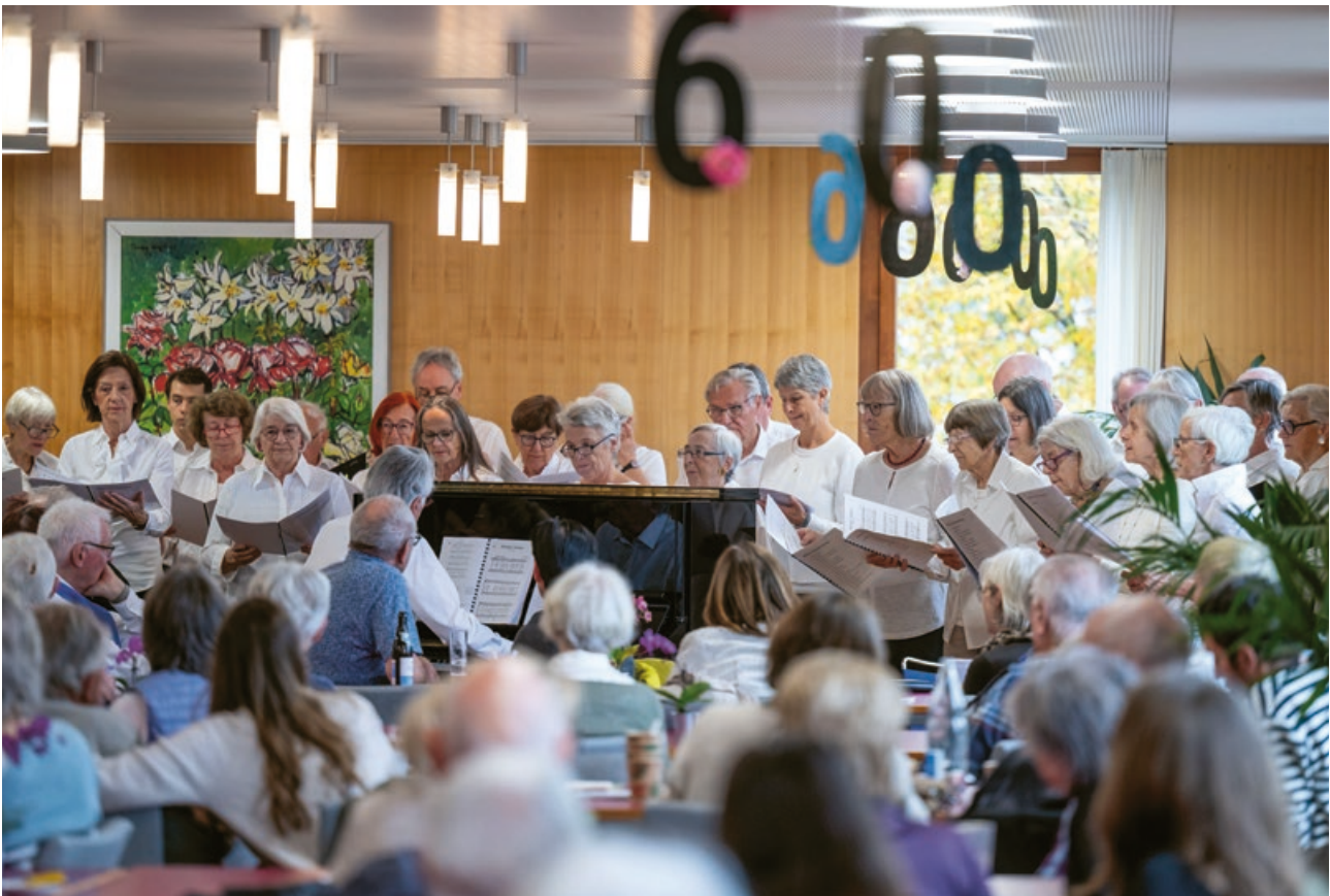
60 Jahre Seniorenzentrum Mülimatt – Jubiläumsfeier vom 8. November 2025.