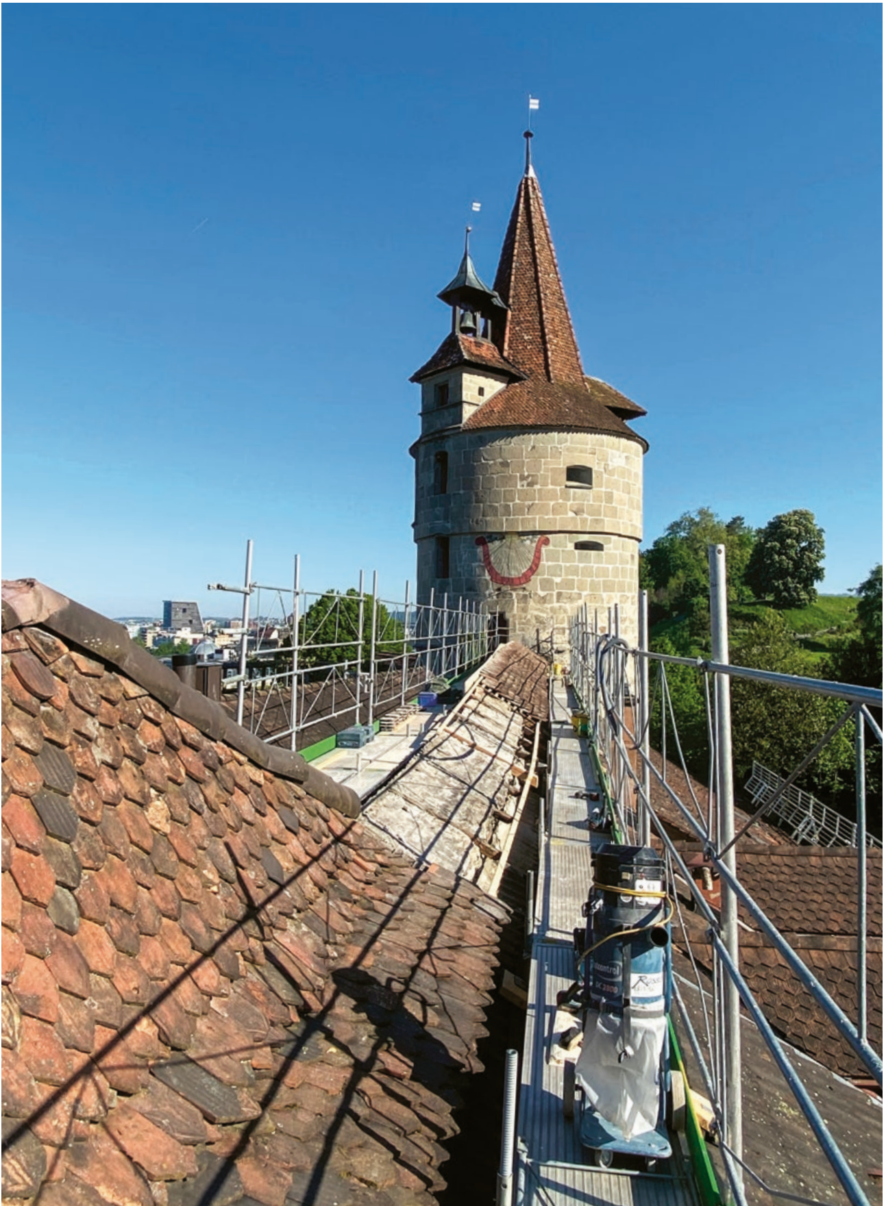
Sanierung der Dachkonstruktion auf der Stadtmauer beim Kapuzinerkloster.